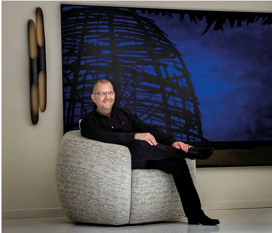
ULRICH STEIN, SESSEL LOOP AUS DER EIGENEN USC KOLLEKTION, BILD: KÜNSTLER: ANDREAS ISERLOTH MASSE: 220X160CM, WANDLEUCHTE: COLTRANE VON DELIGHTFUL, FOTO: © WOLFGANGKOEHLER.COM